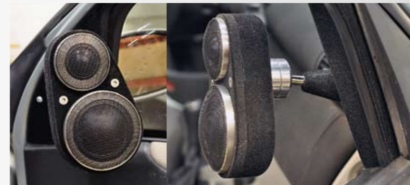
Braxin Matrix-sarjan dome-keskiääni ja diskantti ovat asennettuina vanerista valmistettuihin paneelisiin, jotka on kiinnitetty oven peilikolmioihin säädettävien pallonivel-varsiensa kanssa. Näin oikean suuntauksen hakeminen on mahdollista vielä asennuksen jälkeenkin. Peilikolmioita vasten olevat pohjat on muotoiltu vanerista lasikuitua apuna käyttäen. Kaikkien auton paneelien nukkaukset hoiti tarvasjokelainen alan yritys.