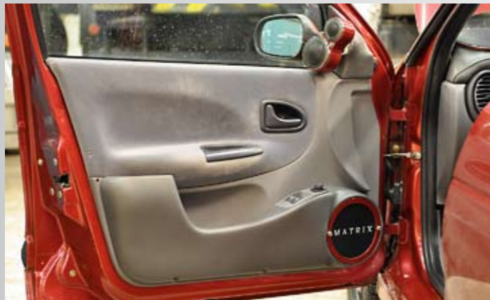
▲ Näyttävän tyylikäs ovikokonaisuus! Tällä hetkellä alimmat kaiutinpaikat toimivat kuitenkin lähinnä koristeina.

▼ ja ► Meganen virtajärjestelmään sisältyy tavaratilassa majoileva pienikokoinen Odysseyn lisäakku, sekä takapenkin takaa paljastuva tyylikäs itse valmistettu sulakekeskus. Konehuoneen pääsulake on integroitu käynnistysakun välittömään läheisyyteen, tarkalleen ottaen sen päälle.