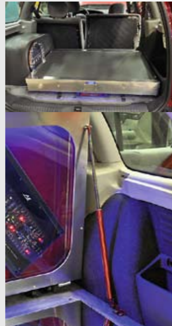
▲ Noin parinkymmenen kilon painoinen laiteteline laskeutuu alas manuaalisesti ja tavaratilaan voidaan vielä lastata oikeasti jotain matkatavaroitakin. Ylä-asennossa telineen pitää jyrkää kaasujousi.