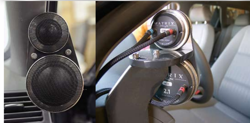
◀ Diskantin ja dome-keskiäänien asennuksessa on käytetty samaa asiallista metodia, jollainen nähtiin myös viime numerossa esitellyssä Isopahkalan Mikon Audissa. Kahdeksan millin alumiinilevystä valmistettuihin telineisiin kiinnitettyt elementit istuvat ilmavasti kojelaudan päädissä ja suuntaaminen on yksinkertaista löysäämällä paria pulttia. Myös johdotuksen suojaus on helpo tarkastaa kilpailutilanteessa.