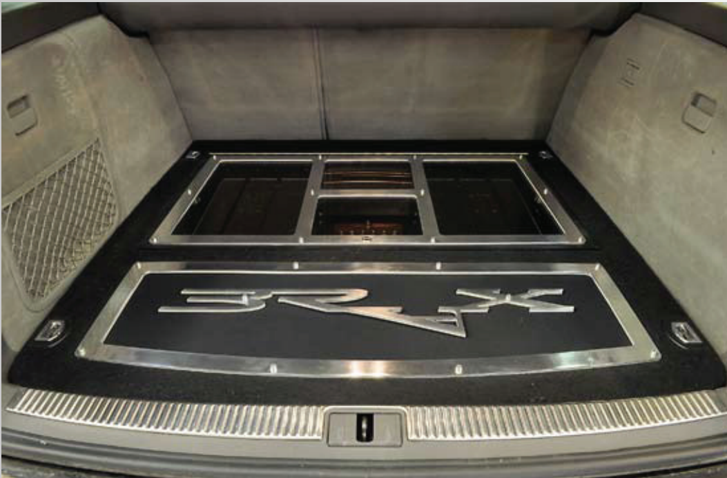
▲ Samaan aikaan yksinkertaista, näyttävää ja toimivaa. Kaikki kontin laitteet ja asennukset on saatu pohjan tason alapuolelle, joten tavaratila on lähes 100-prosenttisesti käytössä.