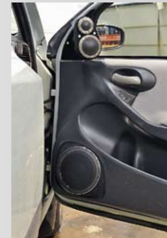
Ovista alemmaa löytyvät Matrix 6.1-midbassot loivasti yläviestoon suunnattuina. Elementtien suuntaimet on kiinnitetty oven M6-läpikululle ovan sisällä olevaa vanerikalustusta vasten.