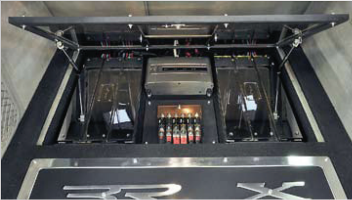
▲ Nice! Kaksi kromattua Braxin high end -päättettä sekä Alpinen F1-signaaliprosu. Myös itse valmistettu sulakeblokki on hieno yksityiskohta. Kansi nousee ja laskee kaasujousien varassa.