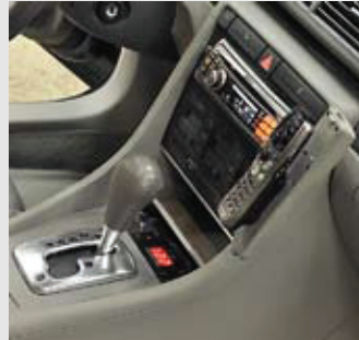
▲ Alpinen F1-sarjan huippuohjelmälähde istuu komeasti keskellä kojelautaa. Soittimen alapuolelta vaihdokopin edestä löytyy Braxin jännite-näyttö.

▼ Soittimelle löytyy pienikokoinen kondensaattori asennettuna hansiklokeroon. Eikä muuten ole mitään huuhaata, parantaa ihan oikeasti äänenlaatua. Konkan vieressä makoille soittimen kookkaanpuoleinen virtälähde.