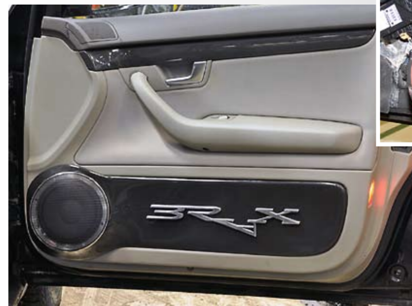
▲ Oviasennuksen kruunaa auton väriin maalattu lasikuitupaneeli ja tyylikäs kiiltävä Brax-logo.