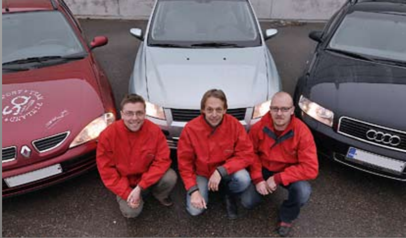
Teksti ja kuvat: Janne Soikari Asennuskuvat: Autojen omistajat