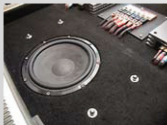
▲ Subbarivalinta on Brax-tiimin autoissa helppoa, koska mallistossa on vain yksi kympittuumainen elementti. Myös tässä tapauksessa asennus on tehty suljettuun koteloon kartio ylöspäin. Kuuntelun perusteella en olisi uskonut, että elementtejä oikeasti on vain yksi. Matalaa tuli ja muutenkin toimi loistavasti.